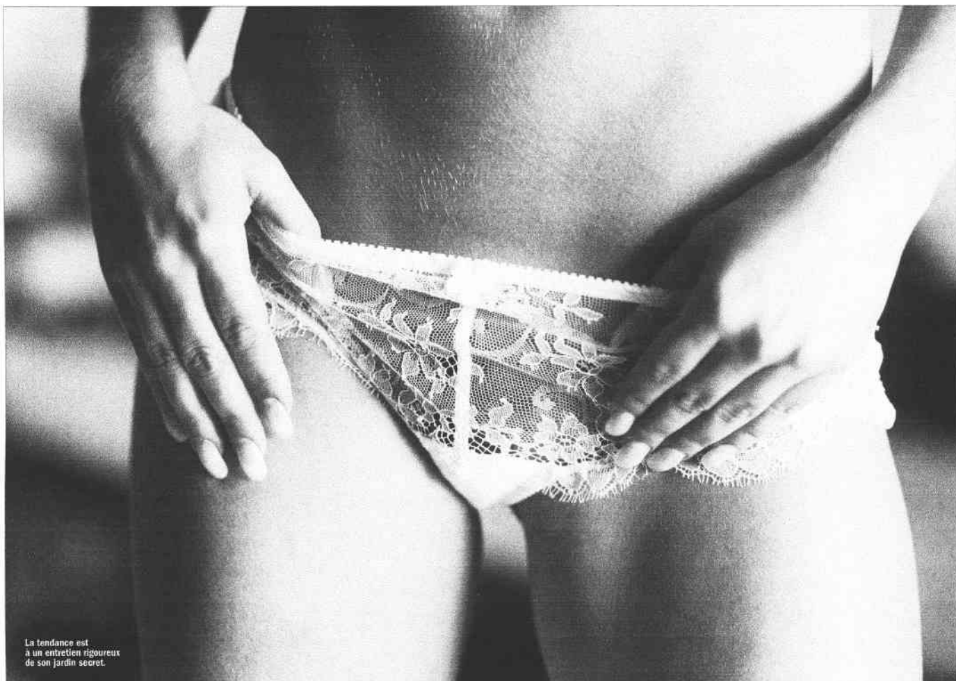
La tendance est à un entretien rigoureux de son jardin secret.